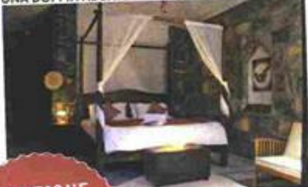
UNA DOPPIA AL SAMA RESORT, JEBEL SHAMS

SOLUZIONE: SAND THERAPY NELLA PENISOLA ARABA